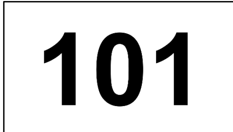
ナンバーカード記入例