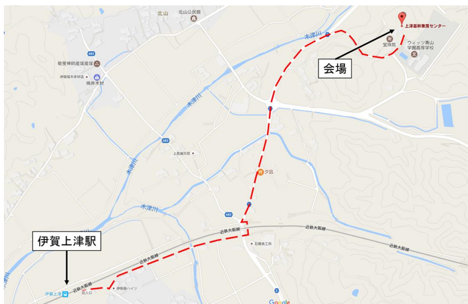
図 2.1 最寄駅から会場 (Google マップ)