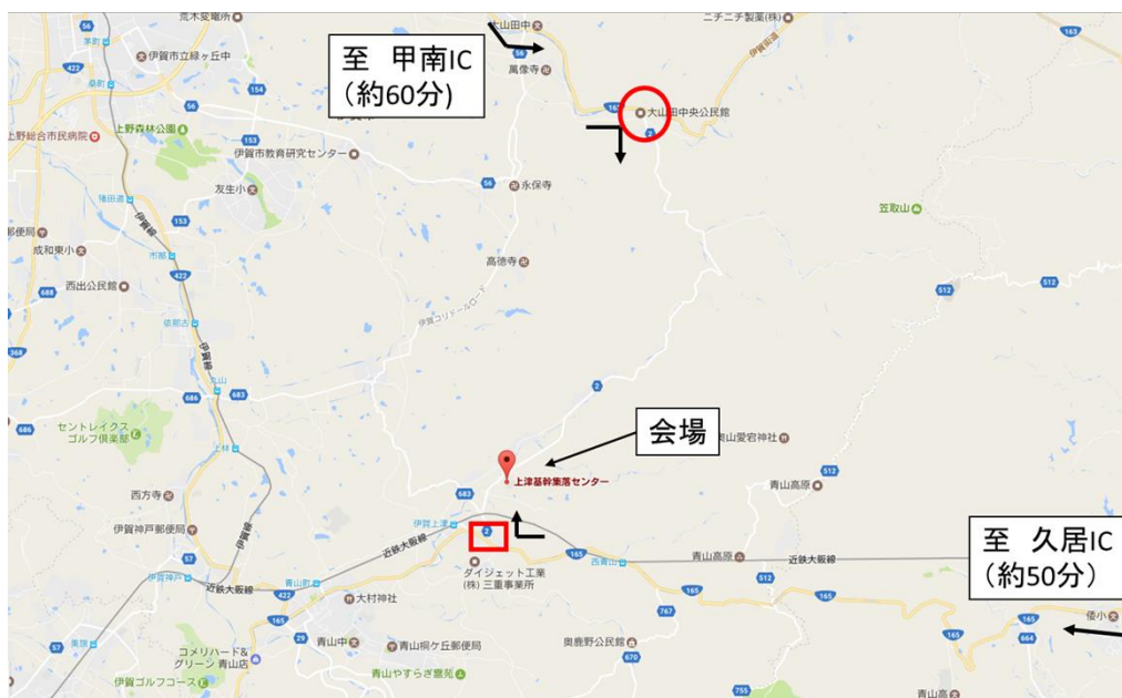
図 2.2 自家用車での会場案内 (Google マップ)