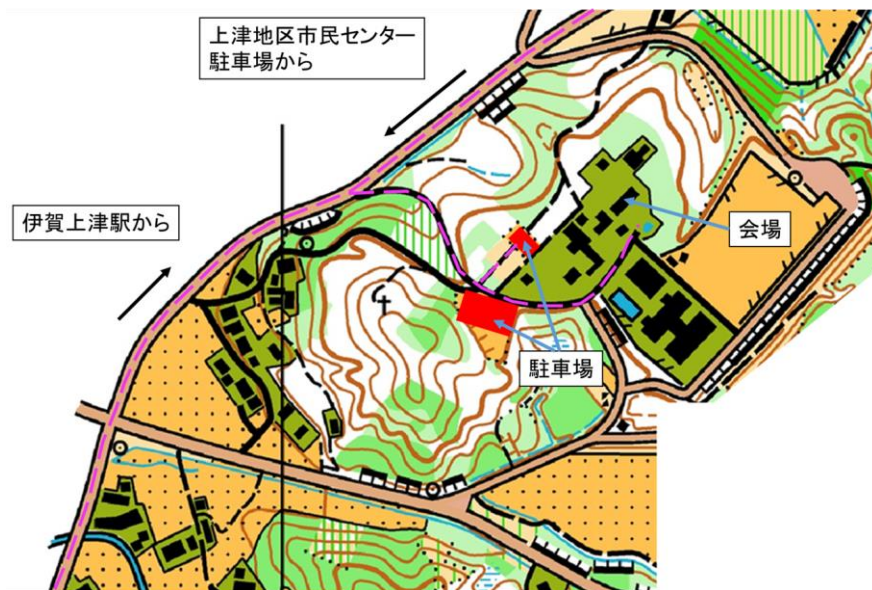
図 2.4 会場付近案内