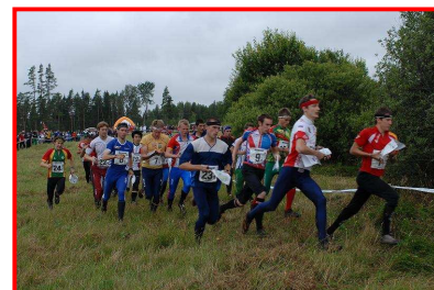
(※写真はユニバ2008より)