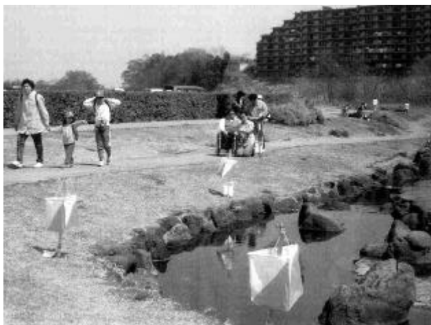
複数のフラッグから正しいものを選ぶ

トレイルOは、まさしく Sport for All そのものとなり、IOFのかかげる4本柱(フット、スキー、マウンテンバイク、トレイル)のひとつとして、急速に世界に広がっています。