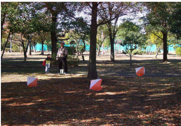
トレイルオリエンテーリングの様子

詳細な大会要綱など (トレイルオリエンテーリング情報) : http://www.trail-o.com/