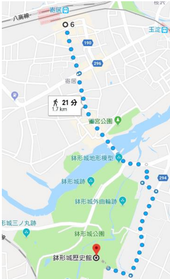
[JR 八高線・東武東上線・秩父鉄道 寄居駅から]