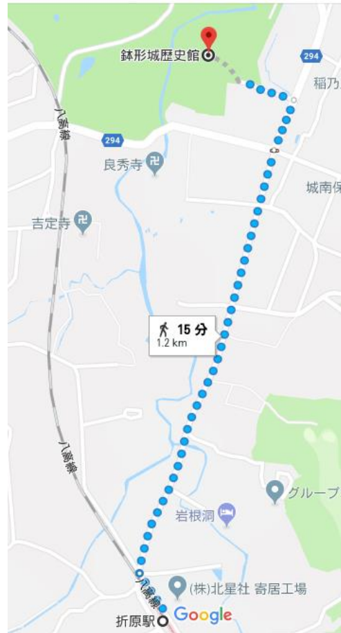
[JR 八高線折原駅から]