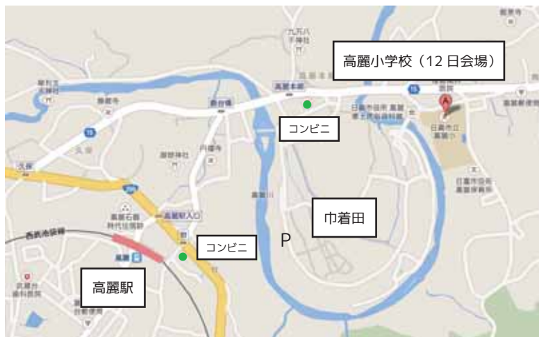
地図データ@ 2014 Google, ZENRIN

飯能駅前から299号を北へ。 中山陸橋（西）の交差点を越え、 中山交差点を右折、150mほど 進むと進むと左側に鳥居が見える ので、それをくぐり北へ。 先にもう1つ鳥居（加治神社）があり、 その中に中山城会館があります。