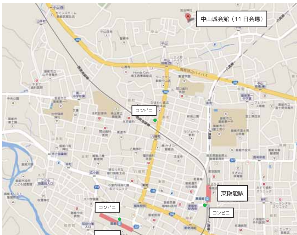
地図データ@ 2014 Google, ZENRIN

※両日とも、会場付近の道路は狭いので、乳幼児や高齢の方を除き、会場への送迎もご遠慮ください。