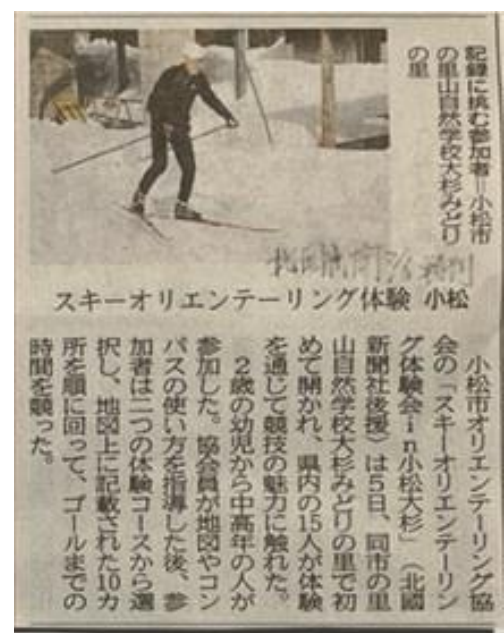
← R4. 3. 6朝刊 北陸中日新聞