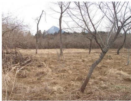
高原風の広葉樹・オープン