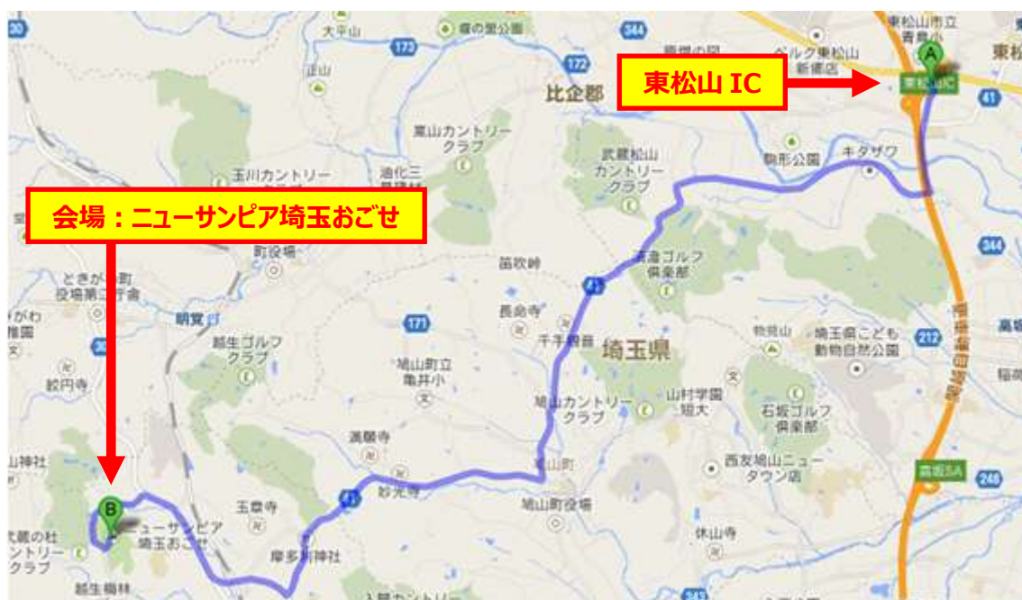
↑ 図：東松山 IC → ニューサンピア埼玉おごせ