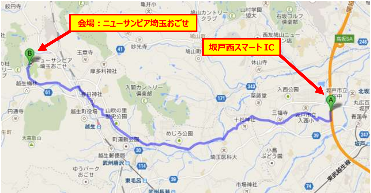
↑ 図：坂戸西スマートIC → ニューサンピア埼玉おごせ