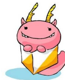
インカレマスコット「れでい・しが」