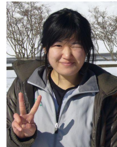
常住さん(記念誌実行委員長)