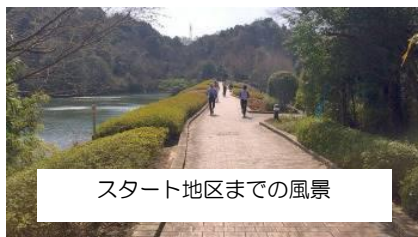
スタート地区までの風景

スタートは、会場から15分程度の小高い丘の上。まずはくんだりから。1→2といくのにどうしようか迷いましたが、結局、道走りぐるっと回ること。コントロ