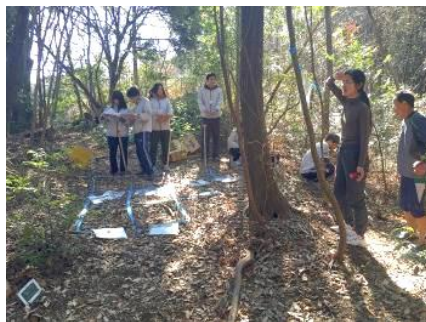
スタート地区の様子

このテレインの特徴は、沢と尾根がわかりにくいというもの（僕だけかな?）。いつも今回の地図で言えば、スタートから3番までの部分の西側の斜面でツボってしまう。今回は、そんなにはまることもなく、なんとか切り抜けた。