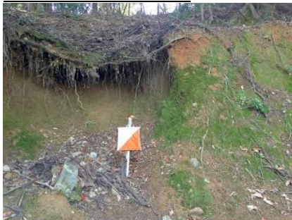
コントロールの様子

このテレインの特徴は、沢と尾根がわかりにくいというもの（僕だけかな?）。いつも今回の地図で言えば、スタートから3番までの部分の西側の斜面でツボってしまう。今回は、そんなにはまることもなく、なんとか切り抜けた。