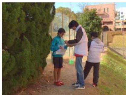
フィニッシュ地点