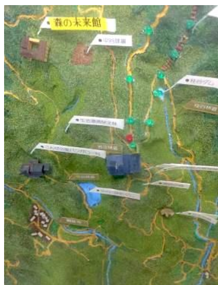
森の未来館にあったトレインの模型

やはり山を使うオリエンテーリングとなると、大変なのが地主との交渉。パークOとは違い地権者が複雑に入り組んでいて、個別の交渉はほぼ不可能。今回はあるオリエンティアが金勝(こんぜ)森林組合とパイプがあったためなんとかトレインを確保することができ非常に感謝しています。今後も、有料でのトレイン使用について交渉しているところです。