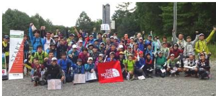
スタート前の総勢 30 組 募集枠いっぱいの参加者が集まった。