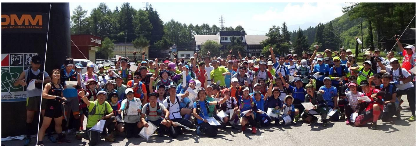
スタートゲート前で記念写真