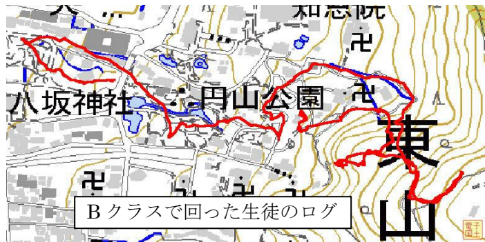
Bクラスで回った生徒のログ

円山公園自体は、平坦な公園なのですが、やっかいなのは東側の將軍塚付近。急斜面が続いていて、大変。しかも、7番付近は尾根や沢がわりとなだらかで、つい違う場所に迷い込んでしまう。