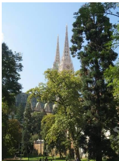
ブレ大会のテレイン

一言 裏方として、助成金をより多くゲットし、また選手のパフォーマンスに少しでもお役にたてればと思います。