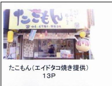
たこもん(エイドたこ焼き提供) 13P

さすがに3時間の一般の部は、猛者がそろって6位までが1000点越えという接戦。次回も楽しめる大会を期待します。