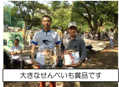
大きなせんべいも賞品です

続いて、10分後に他のクラスがスタートなのですが、スタートをする前に、トップの人が地図交換に来てしまいました。