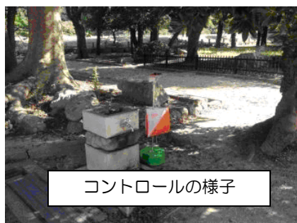
コントロールの様子

明石公園は、明石城跡を中心に作られた都市公園で、園内には多くの樹木や植物が繁茂し、変化にとんだ丘や池、堀は周辺の自然環境と調和して美しい公園です。またテニスコートやあのトーカロ球場や競技場もあり、さらに中央部分は、城壁が再現された明石城跡で高低差があるので変化に富んだコースが組めるところである。