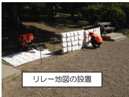
リレー地図の設置

で地図を各自に配置していく。例えば1枚目 BCC/2枚目 CAB/3枚目 ABA というふうにするとう計算上は216通りの組み合わせでレースが組めることとなります。