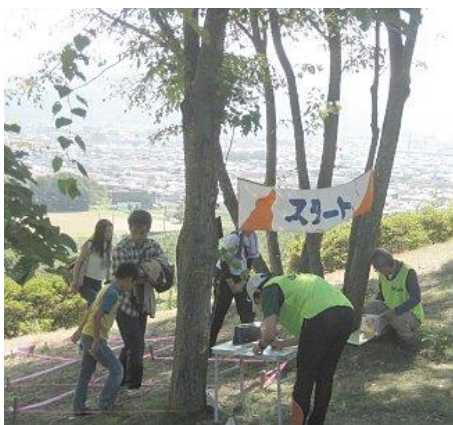
長野市を見下ろす高台からスタート 気持ちよい天気の中、74名が参加。