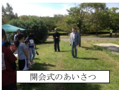
開会式のあいさつ