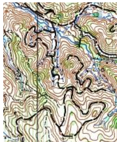
作業道を追加したWOC2005のマップ