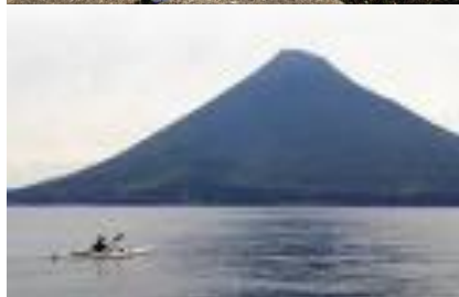
カヌーで屋久島から開聞岳（鹿児島）へ向かう