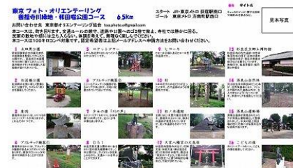
善福寺川緑地・和田堀公園コース