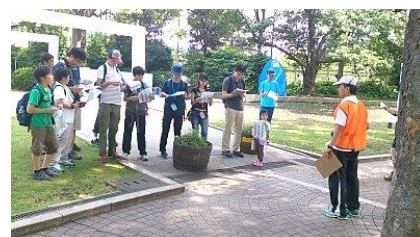
5月24日 東京フォトOシリーズ開始記念大会

また、今後もコースを追加してい く他、初心者向け講習を付けた体験イ ベントも企画していく予定です。 （笠原健司）