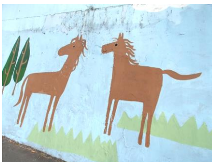
環七の側壁のお馬さん

全34ポイントはすべて馬に関係するものばかり（「キャロットタワー」などは、かなりこじつけでしたが...）。馬事公苑や駒繫神社、駒留神社などはポイントとして予想していた参加者も多かったと思います。ポイント選定当初は馬頭観音ばかりになってしまい、まるで「石仏めぐりロゲイン」でしたが、試走中にいろいろと見つけることができたので、児童公園の木馬や環七の側壁の馬の壁画、さらには「萬馬軒」というラーメン屋など予想外のポイントに参加者の皆さんは驚いたのではないのでしょうか。