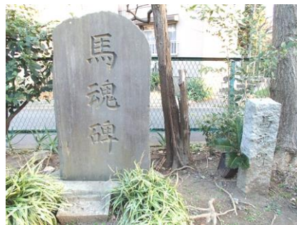
戦死した馬の鎮魂碑