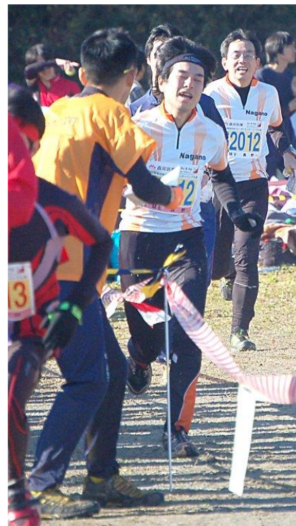
2走から3走にチェンジオーバーする長野県ME選手とMV選手

若い選手が代表を務める都道府県が多く、若手をうまく起用できた都道府県は好成績を上げることができたようだ。