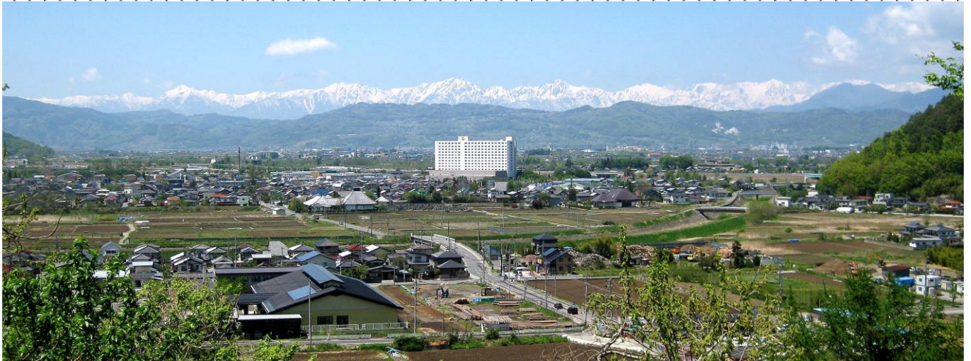
競技中に見えた風景。長野市東部からは北アルプスが良く見える