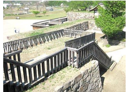
復元された海津城の橋。戦国時代もこんな感じだろうか。

18ヶ月間隔で定期開催するこのイベントも会場都合で今回をもって一旦休眠するらしい。歴史的に魅力あるフィールドなので再開を期待したい。