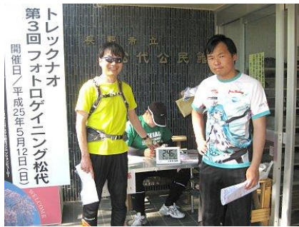
6時間の部フィニッシュ。親子で参加。