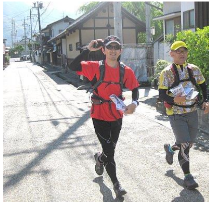
松代の城下町を走る競技者。静かな田舎町に元気なスポーツマインドが注がれる。