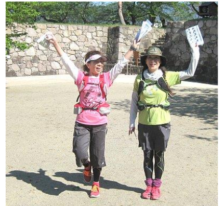
松代城(海津城)を走る6時間女子3位のチーム。実に楽しそう。武田信玄と上杉謙信が戦った川中島の戦いの主戦場だ。