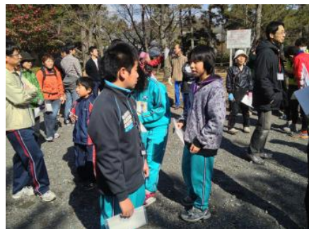
スタート地区の様子

下の公園部分をまず回って、將軍塚周りを南から登っていき、最後は北側を下って戻る…というルートを考えて回り始めました。