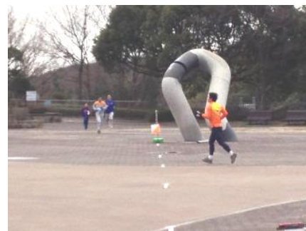
前日に続き、この日も会場から見えるビジュアル区間が用意されていました。