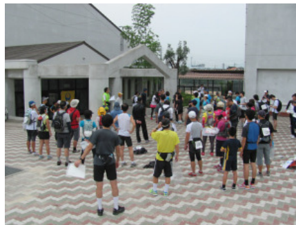
(スタート直前の参加者)

いよいよ競技開始。15分間の作戦タイムのあと、チーム毎に走り出す参加者たち。43のポイントを4時間でいかに点数を考えてまわるかですね。今回は、いくつかのエリアをいくつかに区切って、どこをまわってもあまり開きのないように点数配分をしました。