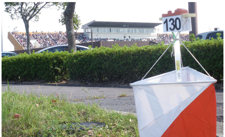
10月16日 サッカーファンで埋まった鈴鹿スポーツガーデン