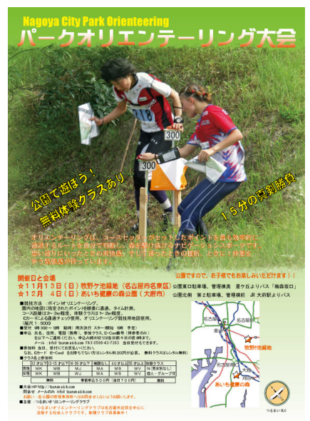
つるまいのパーク O のパンフレット

エバニュー社提供のスタートフィニッシュ幕は 10 月 16 日、23 日、30 日、11 月 13 日とほぼ毎週使われている。