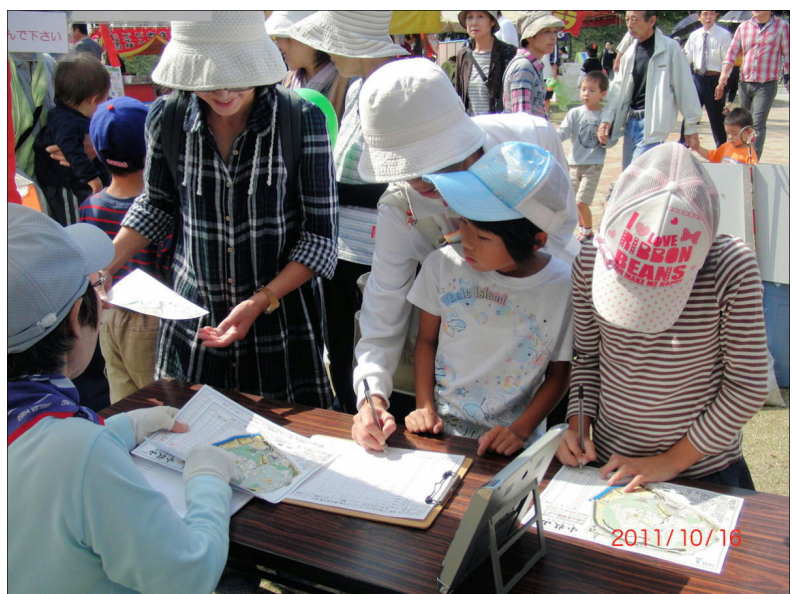
にぎわう小牧市民まつり協賛大会の受付

小牧山は標高 85.9 m、尾張平野の中に孤立し頂上の小牧城からは名古屋市内の高層ビル群や岐阜の金華山