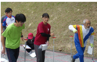
スタートする参加者