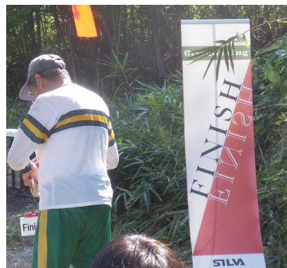
鈴鹿大会に東海地区初登場のエバニュー社提供のフィニッシュ幕

前日降り続いた雨もあがり、全国的にもやや暑かったが、好天に恵まれ70名あまりの参加者が競った。参加者の交通費を考えるとスプリントよりミドルの方が参加者が増える気がした。