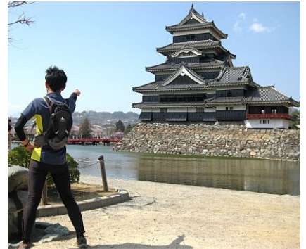
花見試走会の様子。桜吹雪の国宝松本城からトレインを目指してランニング。さらにオリエンテーリングコース試走までをこなす。

今回の地図調査は半分トレーニングでもあり、森を走ることを地元メンバーは楽しんでいる。競技会の準備すら地元メンバーのエンターテイメントとなっている。