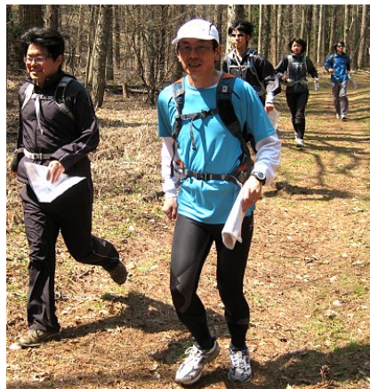
早春試走会の様子。トレーニングを兼ねたトレイルラン。春の森は気持ちいい。

「アルプス公園」からは、眼下に安曇野が広がり、その向こうに北アルプスが見える。「おひさま」と「岳(ガク)」の舞台がいつべんに見渡せる場所が今回のトレインだ。