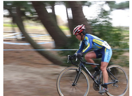
12月12日ビワコマイアミランド 女子3位