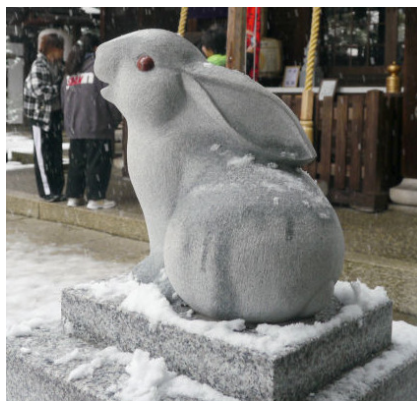
京都 岡崎神社の駒兎？

兎の運動能力は高く、ジャンプ力は高さ50cm幅1mぐらいなら飛び越えられる。走る方は短距離なら時速40km程度は出るが長距離は不得手。