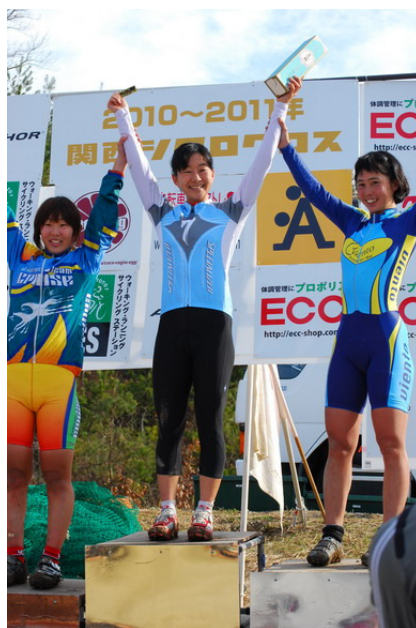
12月20日北神戸大会では2位