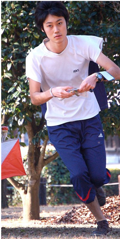
偕楽園外苑を全速力で駆け抜ける

2010年12月11日 茨城県水戸市 偕楽園公園スプリントオリエンテーリング大会