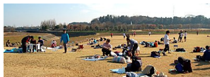
偕楽園公園は広くてフラット

縮尺 1:4,000 の距離感と等高線 2m の感覚、高速で地図を読むタイミングを確認。スプリントレースのナビゲーションを体に覚えこませる。いい感じだ、明日の全日本スプリント大会に向けての感触は上々だ。期待と楽しみが高まっていった。