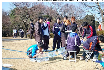
運営は筑波大学の学生が主力