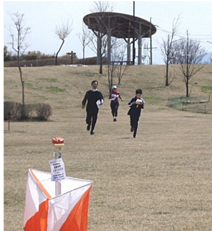
トレイン内見晴らし良すぎ？ 空港公園なので仕方なし。

優勝賞品も自宅のある町内会にあるおいしいケーキ屋から調達。徹底的に松本ローカルにこだわった。