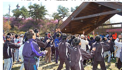
アジア選手権開会式。餅投げに狂喜乱舞する参加者たち。これも文化交流。