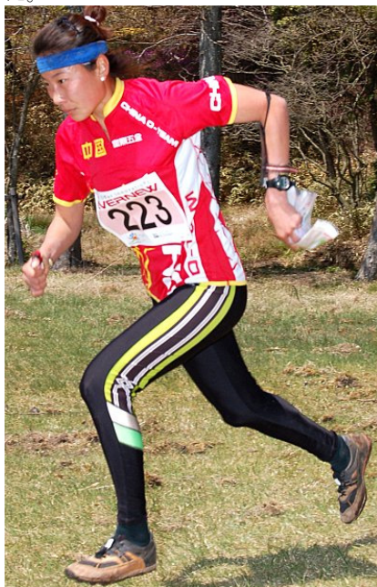
中国女子のもうひとりのエース・ハオ