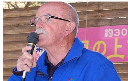
開会宣言。（国際オリエンテーリング連盟副会長ヒューキャメロン）