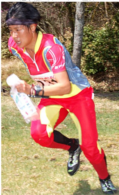
アジア女子最速の足をもつ中国のリ・ジ。 アテネオリンピック陸上競技の入賞者だ。