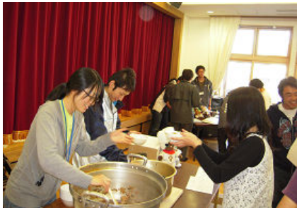
大鍋に作ったひつつみをお代わりする

山形県協会が主催のさくらんぼ大会 のふんだんなさくらんぼ賞品や秋の白 鷹山ロゲインで芋煮サービスを付加し ているのも、目的は多くの集客を目指 してのことである。