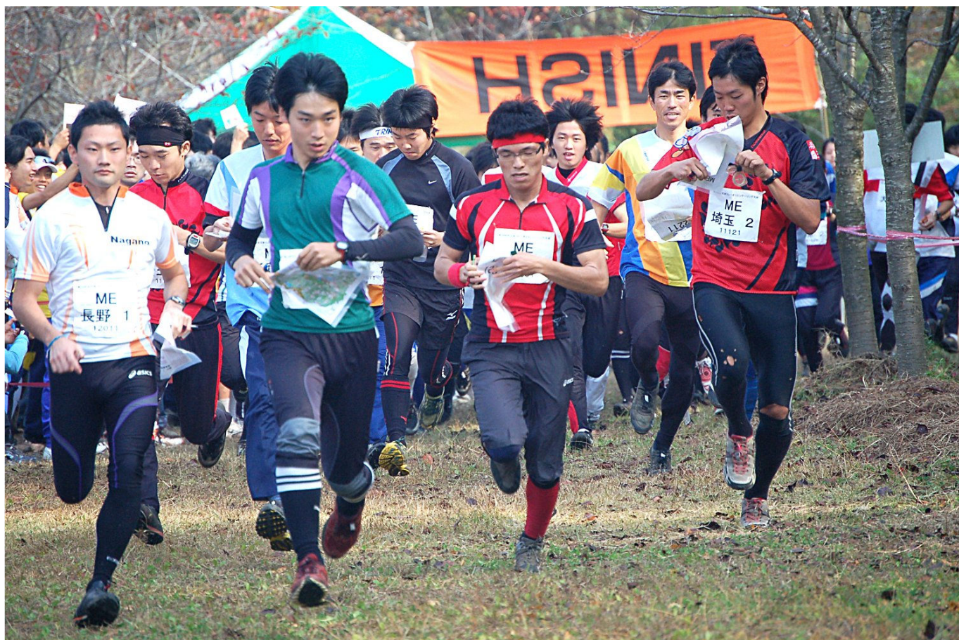
全日本リレー名物。選手権クラスのロケットスタート 会場の都合でスタート直後にレーンが狭くなることが説明され、それを念頭により速いツッコミでスタートしてゆく。 会場となった新潟県見附市の大平森林公園の暖かな日だまりの中、競技は開始された。 (天) 気に恵まれ、テクニカルなテレイン(地)に恵まれ、素晴らしい運営(人)に恵まれた中、大会は無事開催された。

天に恵まれ、地に恵まれ、人に恵まれた越後の地。オリエンテーリング日本一を目指して全国の都道府県から決戦に臨んだ。