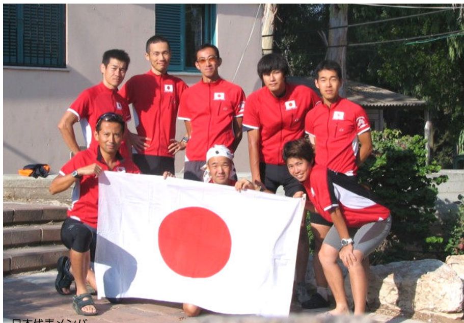
日本代表メンバー。