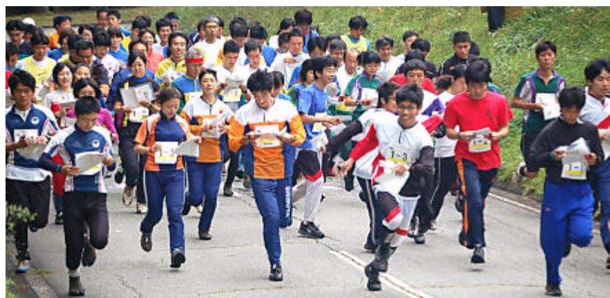
10人リレーのスタート。 10人リレーといっても10人が順番に走るのではなく、9名を3つに分けるフォークリレー方式で走り、最後はアンカー1名で走る。