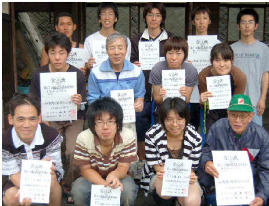
入賞者の面々。地域クラブ、行政、地元学生クラブが一体となった行事。

前日から北信越クラブ連絡協議会が開催され、北信越地区によるオリエンテーリング情報の交換が行われた。