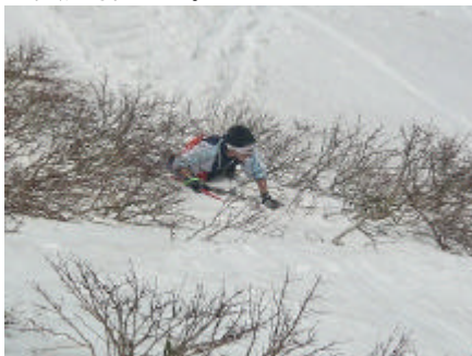
<転んできて気にしない!>

もちろん道具はレンタル可能ですので、スキー道具は持っていないという人でも参加可能です。