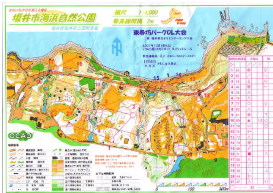
名勝・東尋坊に隣接した海浜公園がトレイン。キャンプ場、手入れされた松林、芝生広場、海岸が広がる。走り易いトレインと精度の良い地図が限界速度まで追い込めるレースを提供してくれた。

林が広がっていて、通行可能性がバツグン。全速力でのオリエンテーリングが楽しめた。