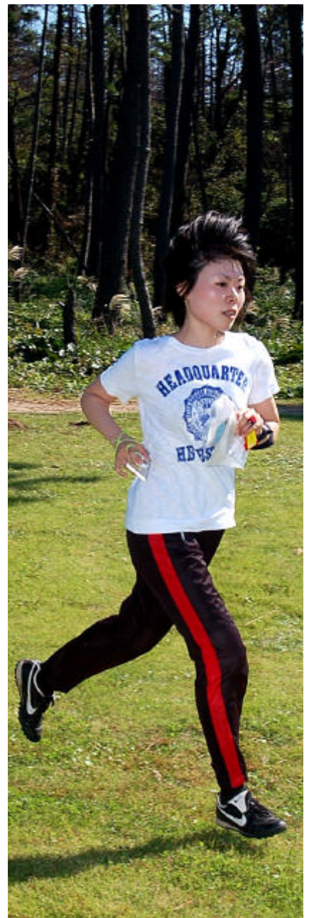
松林と芝生と海のトレイン。走る姿は実にキモチよさそう。

東尋坊にある公衆電話。「いのちを大切に」と自殺防止を呼びかける看板がいたる場所に立っている。ナイト O はやりたくない場所だなぁ。足を滑らせると怖いし。