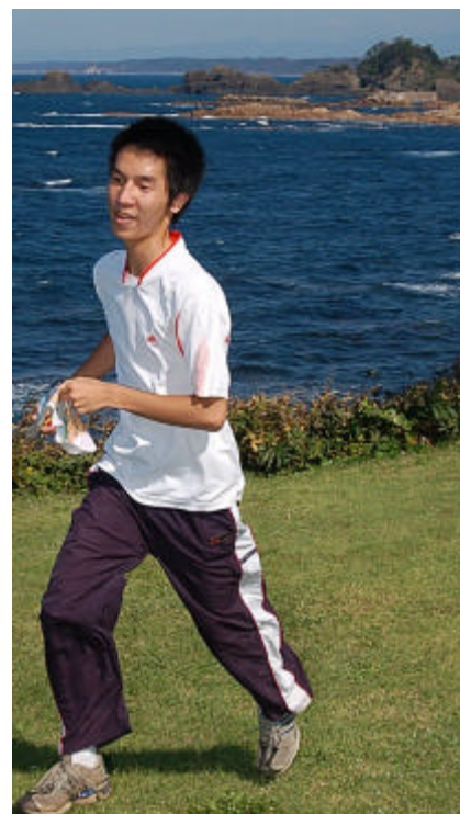
オーシャンブルーに囲まれて走る参加者

全日本リレー大会前日に、北陸有数の観光地のすぐ横で開催されるとあって、全国から多くのオリエンティアの参加があった。全日本リレーのチームメイトに連れられてきた者も、この素晴らしい秋晴れに誘われ、当日参加者が殺到。福井県のオリエンテーリング大会としては破格の250名もの参加者を集めた。