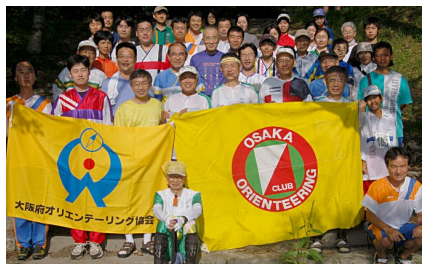
大阪 OLC 夏合宿（駒ヶ根高原）

7月末に入手した腕時計型 GPS を導入し、初めてオリエンティングで試してみました。合宿から家に帰ってからのルート解析がなかなか面白いです。