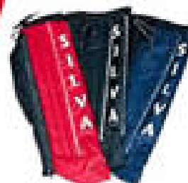
コントロールフラッグ(左)とレガーズ