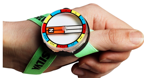
エリートでも愛用者の多いシルバ5jetと660MCスペクトラ