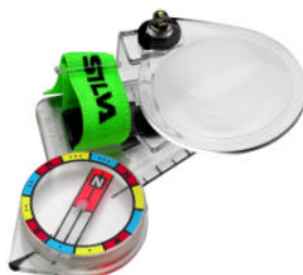
細かい地図も読みやすく。サムコンパスにつけられる拡大鏡