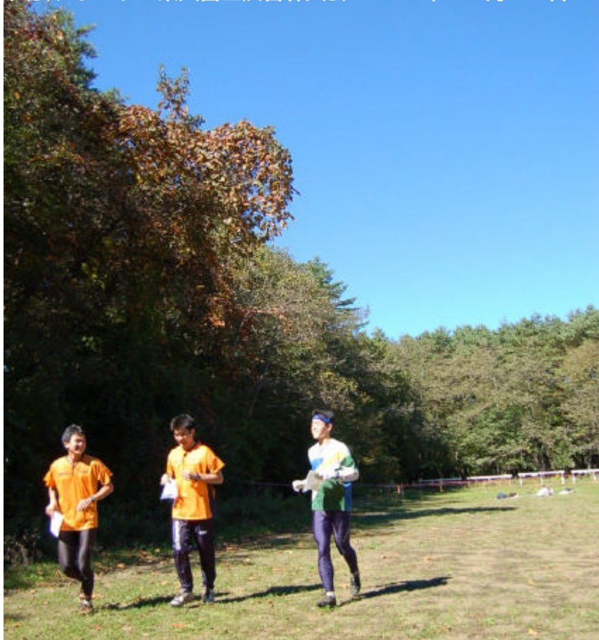
晴天の中レースを終えてクールダウンする参加者