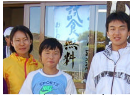
トレインから近い忍野村にあるソバ・うどんの製麺所。「試食無料」に目が眩んで車を緊急停止。お腹いっぱいになるまで試食。ああ満足満足。

大会の日程が岩大大会や、京大大会と重なったため参加できなかった方も多いと聞きます。次の機会を楽しみにして下さい。また山中湖畔でお会いできることを楽しみにしております。 (澤田晴雄)