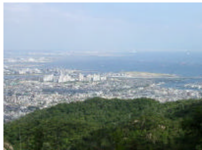
テレインから望む大阪湾の風景。あり得ない気持ちよさです。東は梅田の高層ビル群、西は神戸から播磨灘、南は紀伊水道を望むことができます。

テレイン内からは、大阪湾を一望できる場所があります。二ホンで最も景観がいいテレインであると自負しております。この風景を是非大会に来て味わってください。さらに夜は一千万 $ の夜景となり、昼と夜の両方の顔を楽しまれるのも一興かと思われま。