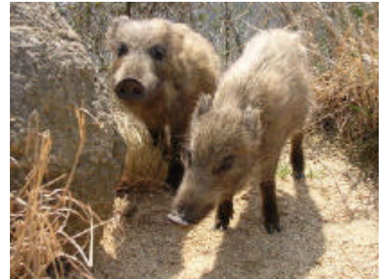
イノシシともお友達になれるかも!

（珍しいからといって近づいたり、触れたりしないようにして下さい。可愛いけれど力持ちですので怪我をするおそれがあります。なお神戸市の条例では全国的にも珍しい「神戸市のししの出没及びいのししからの危害の防止に関する条例」というものがあります。）