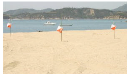
砂浜に置かれたトレイル0のフラッグ これは難しい