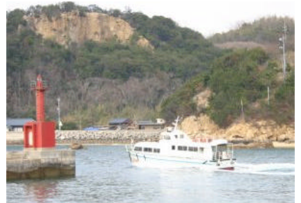
白石島のもうひとつの産業・石材。テレインに石切場がある。ここはガケで危険地帯。もちろんコースからは外している。

12月の全日本リレー前日にはトレイル0も開催する予定。今度はしっかり吟味してトレイル0経験者も唸らせるような、しかも素直なコースにしたい。