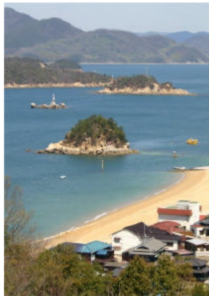
テレインから見える風景 海、砂浜、島、灯台。春の海は美しい。

実は島の東部には低山があり、今までの笠岡市 OL 大会は島東部をテレインとして開催されることが多かった。しかしこの部分は 2005 年 12 月に開催される全日本リレーのテレインに指定され、参加者は立ち入りが禁止されている。そこで今回の笠岡市 OL 大会は島西部の「海上アルプス」を中心にコースが設定された。