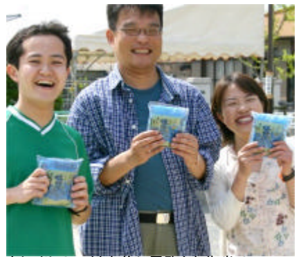
トレイル0では上位に君臨した朱雀 OK 賞品は白石島産の「海苔」 身の厚い海苔はおみやげに人気