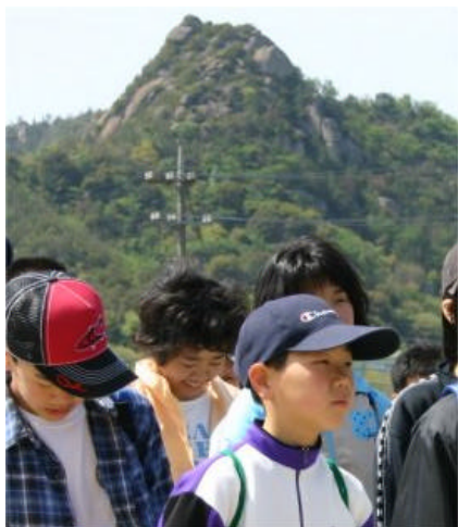
開会式。背後に見える岩山のほぼ山頂に鎧岩(天然記念物)がある。

第 24 回笠岡市オリエンテーリング大会 2005 年 4 月 24 日 (日) 岡山県笠岡市白石島